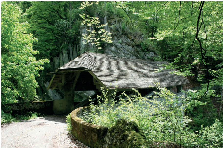
Pont couvert de Lessoc – Vallée de l'Intyamon